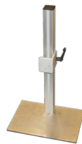
2400 Stativ. klein