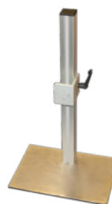
2400 Stativ. klein