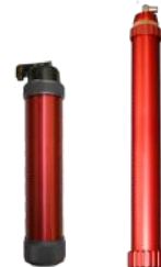
9012 / 9050 Behälter (Schlauch 600 ml)