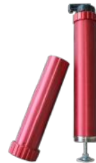
9011 Behälter, pneumatisch