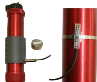
9020-9999 Magnetgrenz-Sensor / 7002-0004 Limitsensor