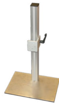
2400 Stativ, klein