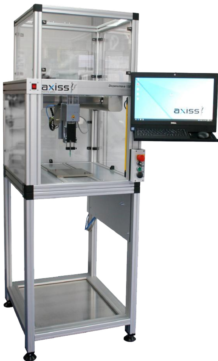
Abbildung mit Art. 3003 Unterbau und Art. 3103 Haube