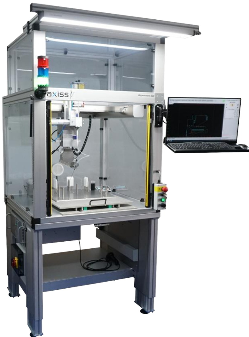
Abbildung mit Art. 3023 elektrischer Unterbau und Art. 3103 Haube