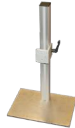
2400 Stativ, klein