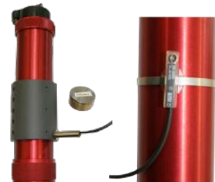
9020-9999 Magnetgrenz-Sensor / 7002-0004 Limitsensor