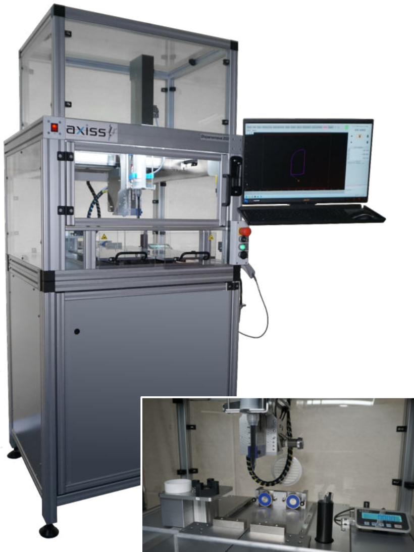
Abbildung mit Art. 3003 Unterbau und Art. 3103 Haube