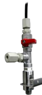
5015-02 Kugelhahnventil mit Schnellverschluss und Sicherheitsblech