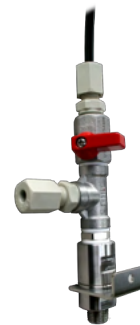
5015-02 Kugelhahnventil mit Schnellverschluss und Sicherheitsblech