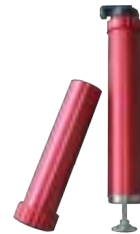
9011 Behälter, pneumatisch