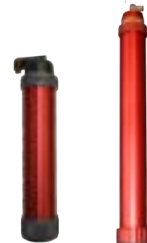
9012 / 9050 Behälter (Schlauch 600 ml)