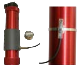
9020-9999 Magnetgrenz-Sensor / 7002-0004 Limitsensor