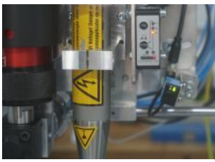
1528 Höhenmesser / Distanzmesser